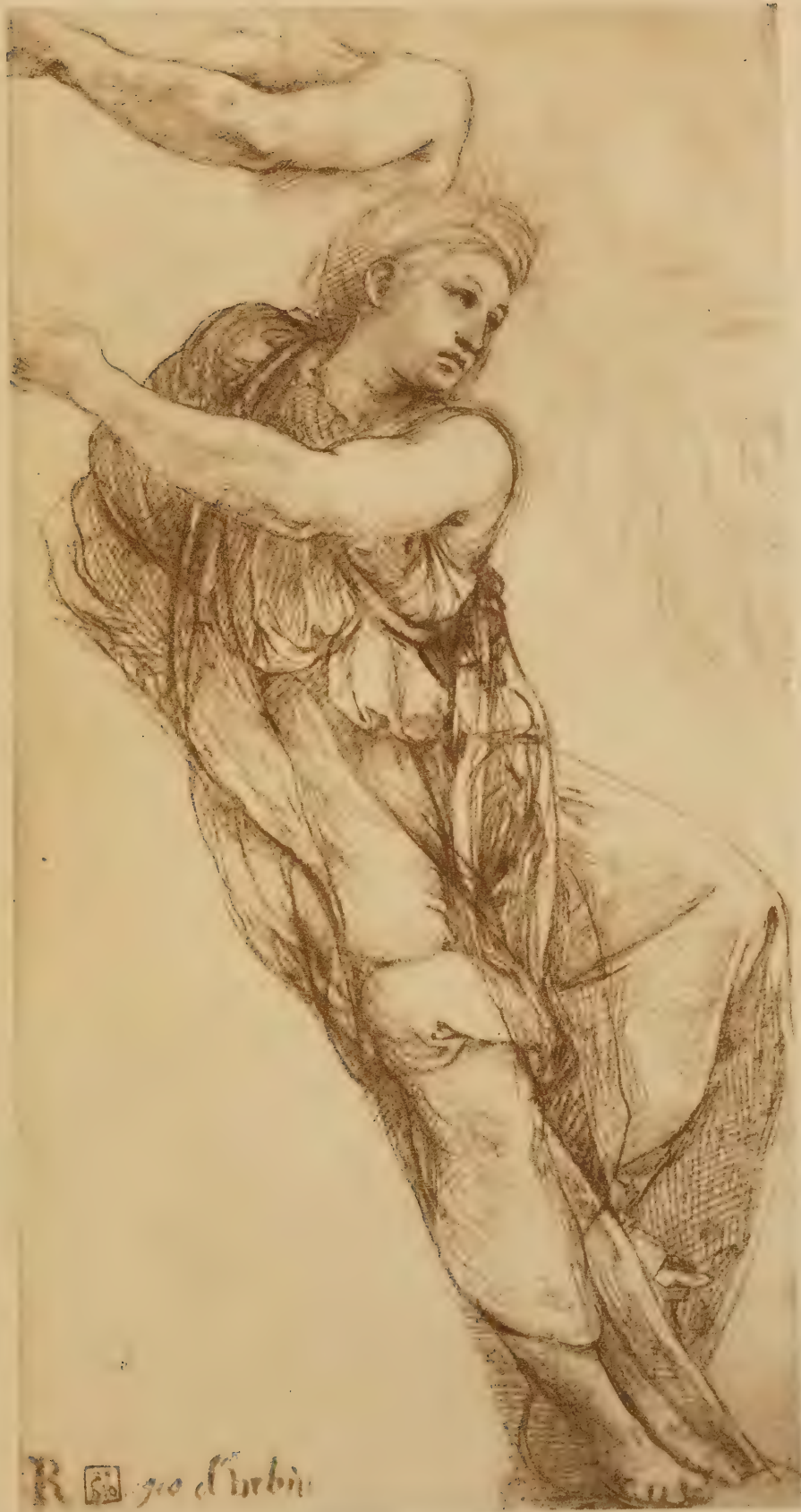
Dessin pour la Sybille de Phrygie de l'Eglise de S. Maria della Pace à Rome